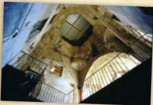
Fermé au public

Le prieuré a marqué fortement le passé de la petite ville. Ce sont sans doute les moines, qui peu satisfaits du comportement à leur égard des sires de Beaujeu, ont demandé et obtenu le rattachement de Régný au Lyonnais. Ce sont également eux qui ont suscités la construction d'une enceinte fortifiée à la fin du XIV e siècle, pour mettre Régný hors d'atteinte des ravages liés à la guerre de Cent Ans.